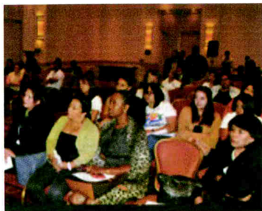
El informe fue auspiciado por el IFES sobre la realidad de la mujer en la política hondureña.

El mejor para las mujeres fue en las elecciones del 2005 porque se alcanzó un 24.5 por ciento de participación de la mujer, no se alcanzó la cuota del 30 por ciento, sin embargo estuvieron cerca las diputadas de alcanzar la equidad. Para las elecciones del 2009 disminuyó a un 19.5 los escaños ocupados por mujeres, por el impacto de la crisis constitucional que originó la renuncia de algunas candidatas a puestos de elección popular.