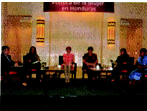
Mujeres políticas participaron en el panel analizando la cuota de poder para ellas.

La plena participación de la mujer en la vida pública es una asignatura pendiente en muchos países y Honduras no es la excepción, a pesar de los avances logrados en los últimos años, concluye el informe presentado por la Fundación Internacional para Sistemas Electorales (IFES), por sus siglas en inglés, y el Instituto Nacional Demócrata para Asuntos Internacionales.